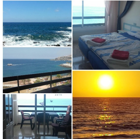
grössere Zimmer mit Balkon