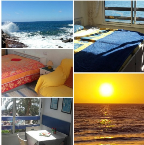
Einfache Studios in Arguineguin

Hier stehen uns kleine und mittlere Studios, die wir uns gemeinsam teilen werden mit Zimmern zur Verfügung. Alles wird nach Eurer Anmeldung definitiv gebucht. Die ersten Personen mit bezahlter Buchung erhalten die grösseren Zimmer (2 Zimmer mit Balkon) die anderen zum Teil mit Blick aufs Meer (Zimmer-Verteilung nach Eingang der Anmeldungen)